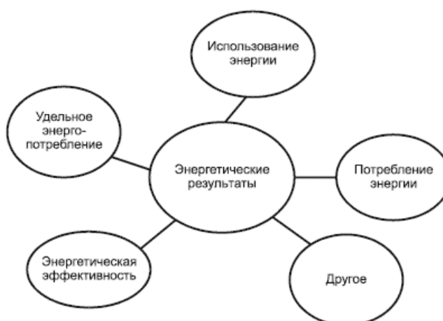
Рисунок А.1 - Концептуальное представление энергетических результатов

Концептуальное представление энергетических результатов приведено на рисунке А.1.